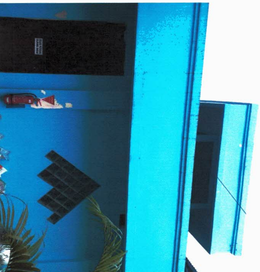
RENCANA SEBAGAI RUANG TRANSIT PASIEN POST RAWAT INAP YANG SUDAH DIPERBOLEHKAN PULANG