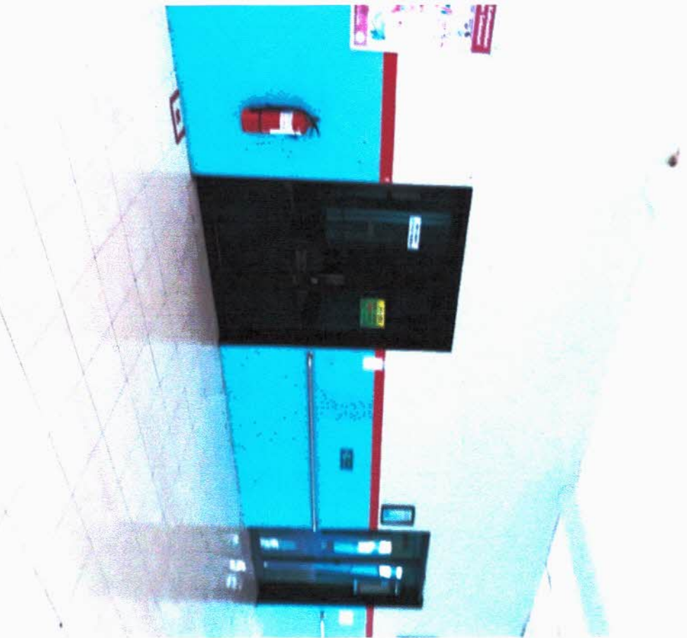
RENCANA PENGEMBANGAN POLIKLINIK DAN RUANG TRANSIT PASIEN YANG AKAN RAWAT INAP